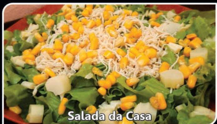
Salada da Casa